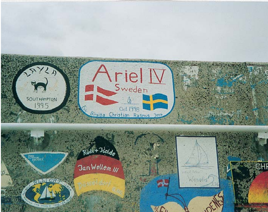
Skeppsmålningar på muren i Pôrto Santo hamn. Karnevalen på Trinidad – en oföglömlig upplevelse.