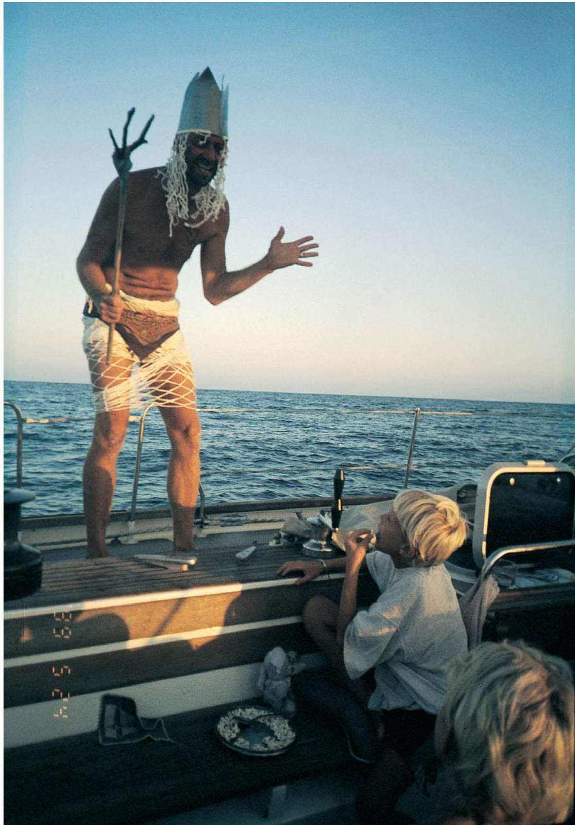
Kung Neptun stiger upp ur djupet.