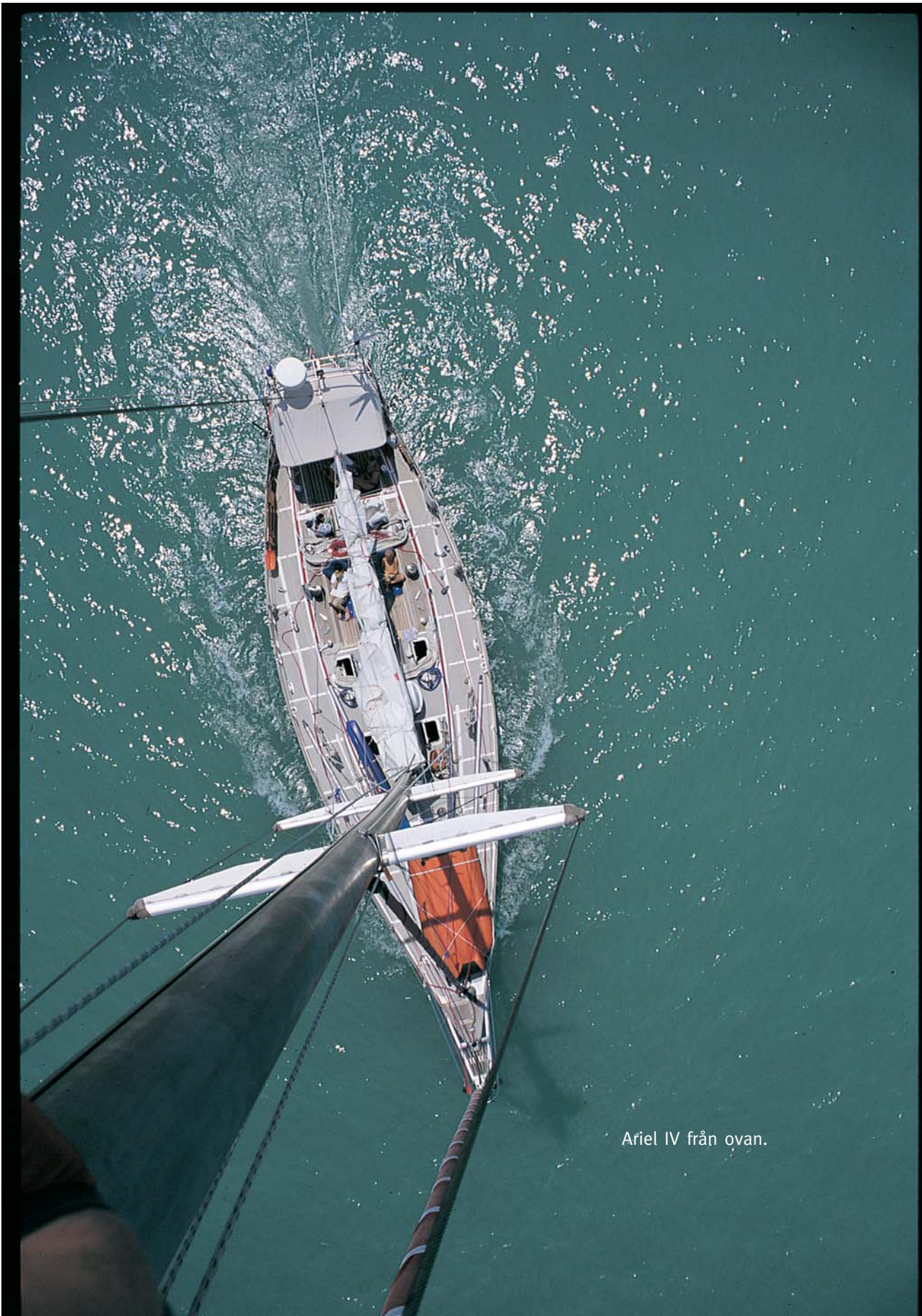
Ariel IV från ovan.